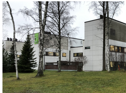
Kuva. Maapinta-ala 1 050 m2.

Asianajotoimisto Project Law Oy / Asianajaja Matias Forss:n laatimassa; "Oikeudellinen selvitys poikkeamisluvan myöntämisen edellytyksistä" -lausunnossa todetaan, että; " Ympäristö- tai muulla vaikutuksella tarkoitetaan tässä yhteydessä päästöjä tai liikenteen lisääntymistä tai muuta vastaavaa ympäristölle aiheutuvaa haittaa. Suunnitellun rakentamisen vaikutuksina voidaan pitää mahdollista asemakaavan sallittua korkeamman rakentamisen aiheuttamaa ympäristön varjostamista tai näkymien peittämistä. Suunniteltujen rakennusten sijainti vastaavan korkeisen B-rakennuksen vieressä tarkoittaisi kuitenkin, ettei tilanne näiden tekijöiden suhteen muutu olennaisesti. Tällöin poikkeamisen myöntämisestä ei seuraa merkittäviä muutoksia ympäristössä tai vaikutuksia muiden maanomistajien alueella. " Lausunto on liitetty lupapisteeseen, poikkeamislupa-aineistoon.