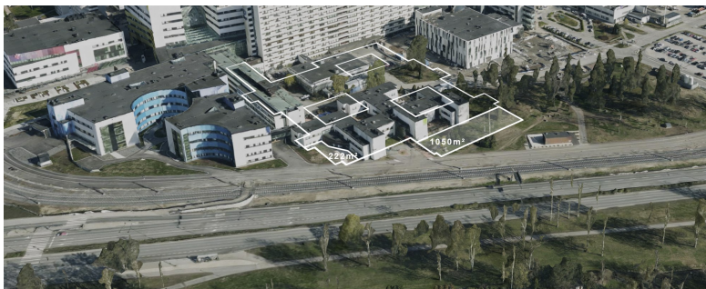
Kuva. Ilmakuva poikettavista alueista ja istutusalueen osista.

Edellä olevan lisäksi kuitenkin voidaan todeta, että TAYS Uudistamishankkeen sairaalatoimintojen tarvittavat osat työntyvät vain vähäisiltä osin (222 m 2 ja 1 050 m 2 ) istutettavaksi määrätylle alueen osalle, että poikettavat alat ovat niin vähäisiä, että tarvetta asemakaavamuutokselle ei ole. Istutettavaksi määrätylle alueen avoimille osille voidaan rakentamisvaiheessa istuttaa poistettavien puiden (6 kpl lehtipuita + 5 kpl nuoria kuusia) tilalle lisää uusia puita.