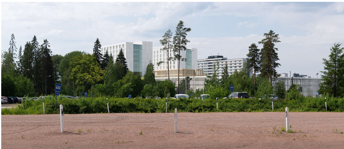
Kuva. Teiskontien sisääntuloväylän TAYS-näkymä.

B-rakennuksen asema historiallisena arkkitehtuurin sommitelmana säilyy osana uudisrakentamisen kokonaisuutta. Uudisrakennukset on suunniteltu samaan koordinaatistoon A- ja B-rakennusten kanssa.