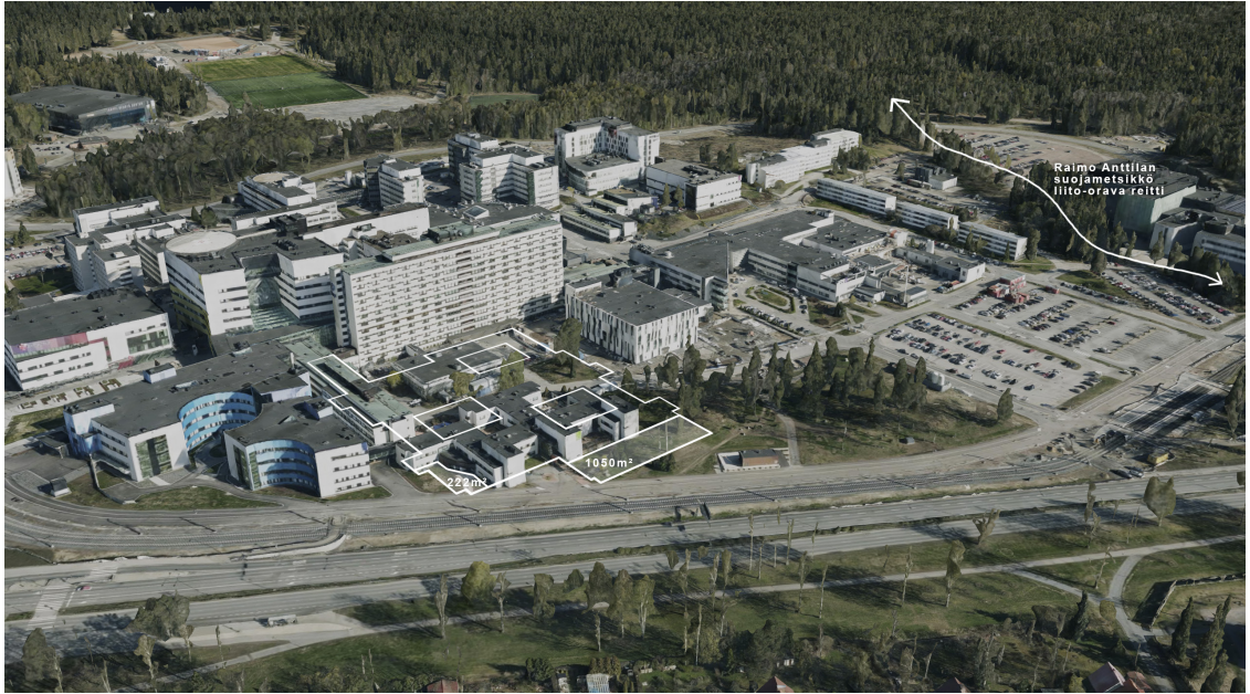
Kuva. Poikkeamisalue ja suojeltu liito-oravareitti (sl-2, Raimo Anttilan suojametsikkö).

ELY-keskus on 25.11.2021 antamassaan lausunnossa todennut, että; ” Poikkeamisluvan myöntäminen ei vaikeuta luonnonsuojelun tavoitteiden saavuttamista. Poikkeamisella ei ole tältä osin vaikutusta asemakaavassa turvattuihin liito-oravan esiintymiseen tai kulkuyhteyksiin alueella. ”