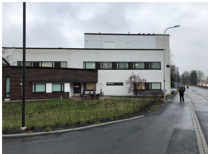
Kuva. Maapinta-ala 222 m2.